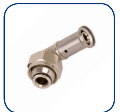
33P Ø 16

Articles pour compléter l'installation Henco Ecoline : une pompe de circulation et une valve de circulation thermostatique (ne fait pas partie de la gamme Henco).