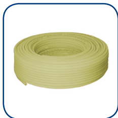
Henco 1L PEXc