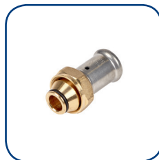
19P Ø 16-20