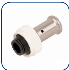
19PK Ø 16-20