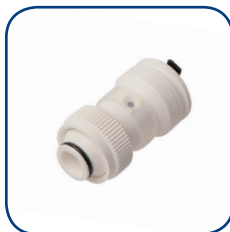
19SK Ø 16-20