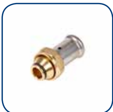
19P Ø 16-20