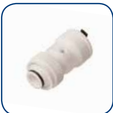
19SK Ø 16-20