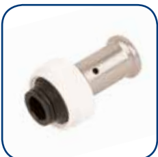
19PK Ø 16-20