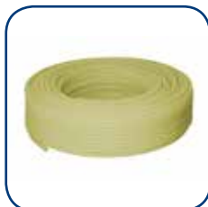
Henco 1L PEXc