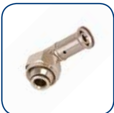
33P Ø 16

* Para realizar la instalación Ecoline tiene que tener una bomba de circulación y una válvula termostática de equilibrado (no en la gama Henco)