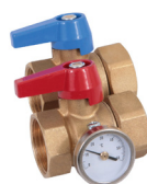
UFH-BTM0606-M Longueur + 60mm