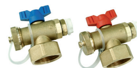
UFH-ESK060303-M Longueur + 60mm